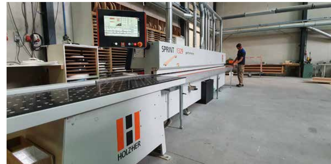
Deze machine is voorzien van zowel een automatisch beladingsysteem als stickersysteem.