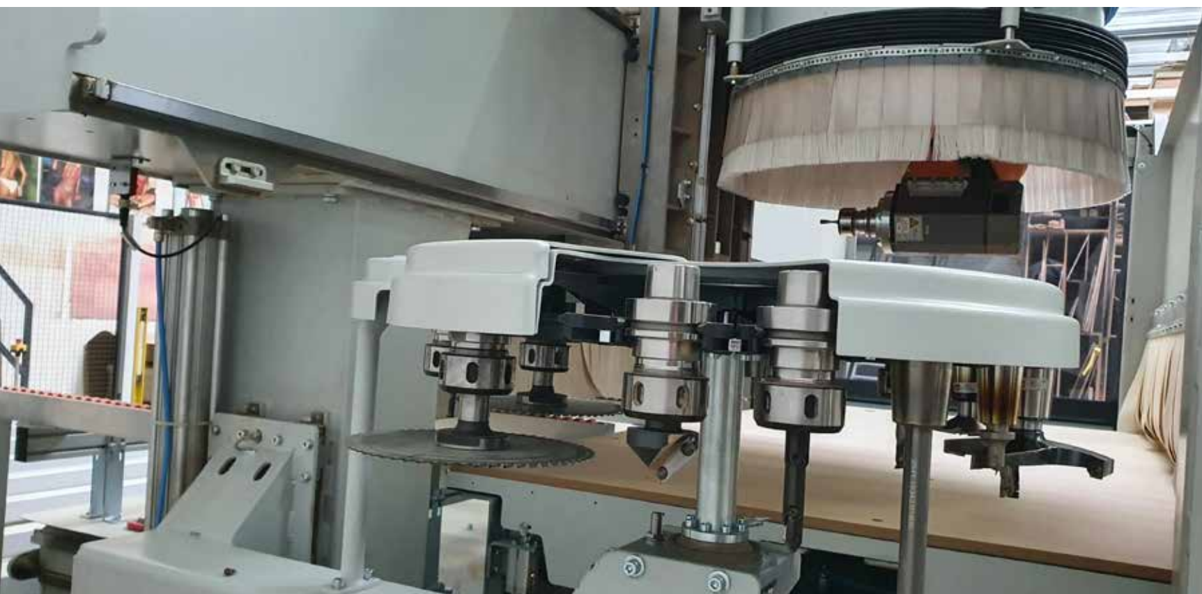
Het was logisch om voor een groot formaat CNC-machine te kiezen.